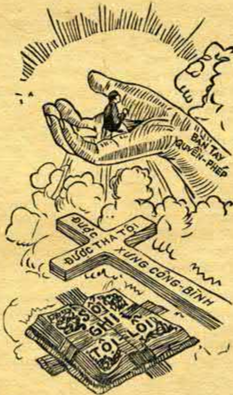
Chịu chết, Đấng Christ xóa sổ ghi tội-lỗi chúng ta. Sống lại, Đấng Christ có toàn-năng gìn-giữ chúng ta.

Nhưng Ngài không ở trong mồ-mả, vì Đức Chúa Trời khiến Ngài từ kẻ chết sống lại, tiếp Ngài vào trong vinh-hiền, và đặt Ngài ngồi bên hữu mình, tại đó Ngài sống đời đời để cứu thay cho các thánh-