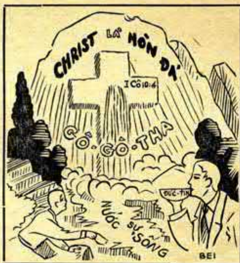
Đức Chúa Jêsus là Vầng Đá muốn đời làm thỏa-nghuyện linh-hồn tin-cậy Ngài