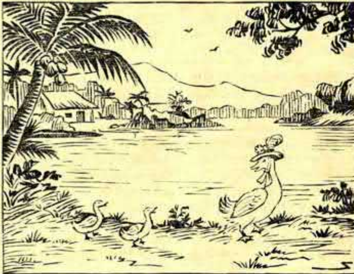
Bà Vịt đội mũ, đeo nơ, đi chơi với hai con.

Nhưng ghé-sở thay! Khi về tới ờ, quả thật, họ thấy cái cảnh tai-nạn đáng thương! Hai cái trứng xinh-đẹp, phơn-phớt xanh, đã dập-nát hư-hỏng; ờ cũng bần-thiếu, tan-tành! Bà Vịt nghệt hơi, phải ngồi chồm-hồm vì hai con run-