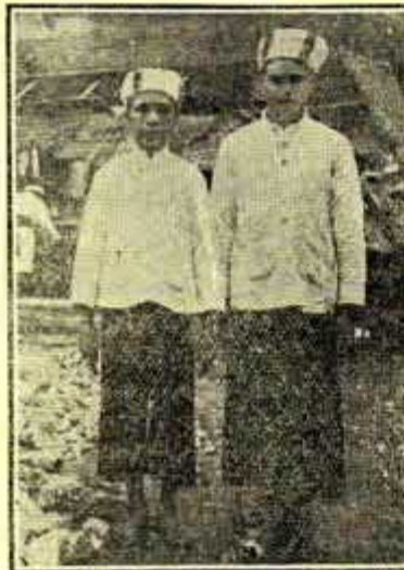
Người Nùng, thượng-du, Bắc-kỷ