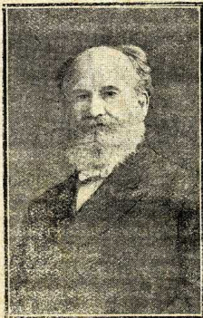
A. B. SIMPSON

1. — Đức Chúa Trời là nơi ẩn náu duy nhất của tội-nhơn. Ta lọt lòng ra đời, đóng một vai trên sân khấu mà không có quyền tự-do lựa-chọn. Sống ở đời, ta cần dùng không biết bao nhiêu mà kể, chỉ có Chúa mới cứu-giúp cho được. Ta cần phải có Đấng